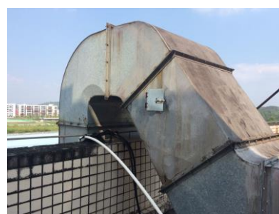
處理前抽樣檢測口