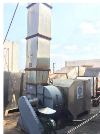
紫外線光催化系統