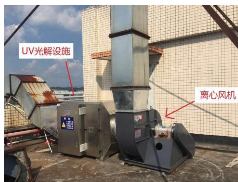
紫外線光催化系統

由於工廠在生產過程中設有印刷工序，所採用的溶劑主要為溶性油墨，會釋出具刺激性及揮發性的有機廢氣，人們接觸後，眼睛和呼吸道有機會受刺激，以及有皮膚過敏反應，亦會產生頭痛、咽痛與乏力，一些VOC還包含了致癌物質，因而對車間及周邊環境有很大的影響。英德現時在凹印車間有8台印刷機，每台印刷機均配有廢氣收集系統，並使用活性炭吸附作基本處理，但處理效率不大，因此企業計劃對廢氣處理設施進行升級改造。